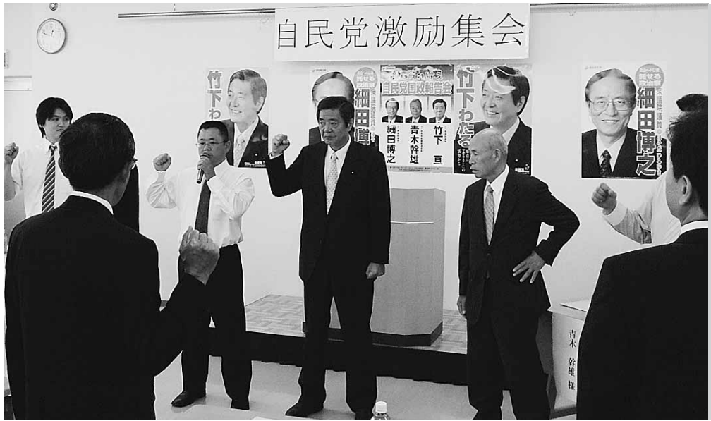
自民必勝へ氣勢を上げた激励集会Ⅱ出雲建設会館

衆議院の解散総選挙を前にした7月初旬、建設産業界による自民党激励集会が出雲建設会館で開かれ、建設業協会や同青年部会、建産連各団体の代表ら総勢50人が結集し、必勝に向け結束を誓った。