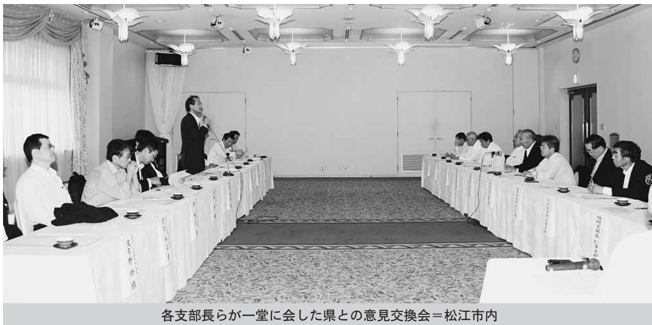
各支部長らが一堂に会した県との意見交換会＝松江市内

また、総合評価方式については「技術提案を求めない特別簡易型などで、最低制限価格の設定ができないか」という問いに対し、県は「地方自治法等の趣旨からも低入札のみ認められているという解釈をしており、最低制限価格の設定は妥当ではない」と回答。ほ場整備や生活