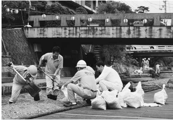
(上)小雨まじりの中、玉湯川の散策路に溜まった土砂を取り除く（松江支部）

安来＝鷲の湯温泉夢ランドしらさぎ周辺と飯梨川河川敷の清掃▷雲南＝特別養護老人ホーム梅里苑の清掃▷仁多＝314号（ドライブイン三井野ーJR坂根駅間）、鬼の舌震い周辺のごみ拾い▷出雲＝431号（松江市境界ー9号神西交差点間）のごみ拾い▷大田＝9号（大田市大田町ー温泉津町間）のごみ拾い▷邑智＝島根中央高校の立木伐採、草刈り等▷浜田＝浜田漁港および周辺地のごみ拾い▷隠岐＝海士町内幹線道路のごみ拾い