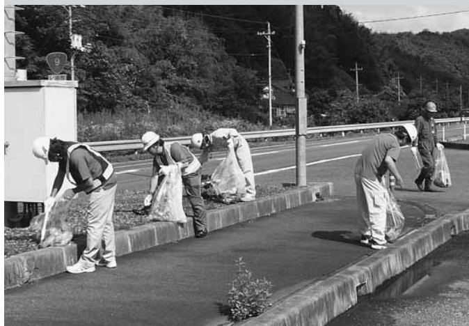
(下)歩道や植樹帯のごみ拾いに汗を流す（益田支部）