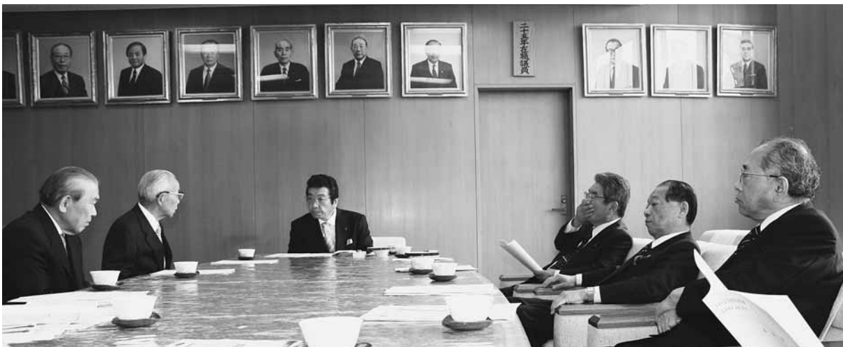
業界の要望について懇談する自民党県議会議員の面々 〓 県議会議長室