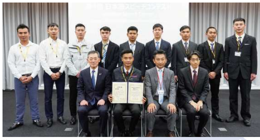
第4回スピーチコンテスト（昨年）表彰式後の記念写真（前列：理事長、最優秀、来賓2名）