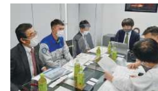
処遇・人権尊重状況に関する訪問確認