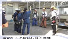
高校生への技能体験会講師（外国人技能者が講師を担当）

竹中工務店と竹和会は、外国人技能者の皆さんが働きやすい環境を整えながら人材育成活動を進めていきます。外国人技能者の皆さんには、建設技能を身に付けるとともにコミュニケーション能力を高めることにより、建設現場で優れたリーダーシップを発揮し日本の建設業を支える中心として活躍頂けることを期待します。