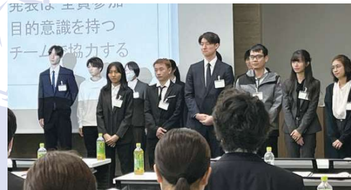
竹中工務店・竹和会による「新人研修」（外国人技能者も参加）