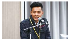
最優秀受賞者発表風景

外国人建設技能者の皆さんには、日本の言葉と共に、“日本の文化”についても理解し、共感していただければと思います。今後弊財団として「日本語と日本の文化」を皆さんにお届けしていくことも検討中ですので、どうぞご期待ください。