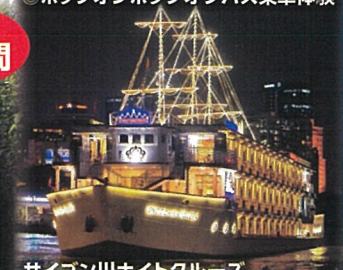
サイゴン川ナイトクルーズ