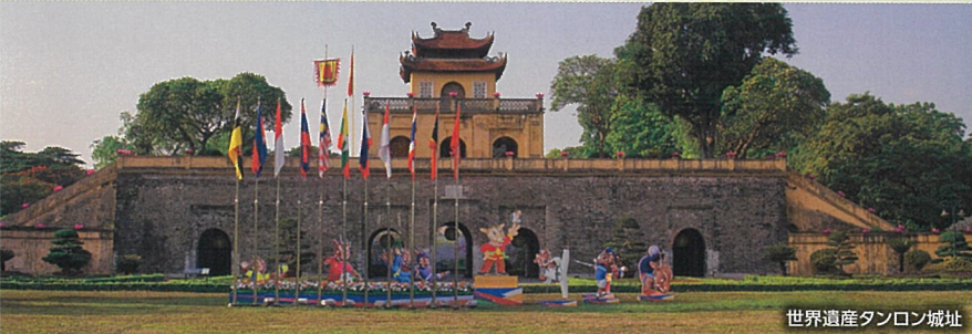
世界遺産タンロン城址