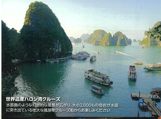
世界遺産ハロン湾クルーズ

D ホーチミン連泊! プチ・パリ ホーチミン満喫 デラックスクラス ホテル利用 269,800円