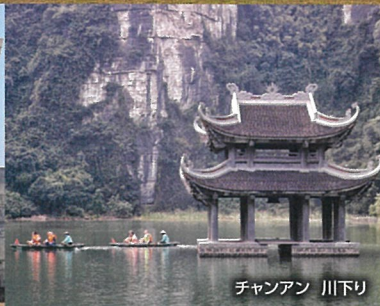
チャンアン 川下り