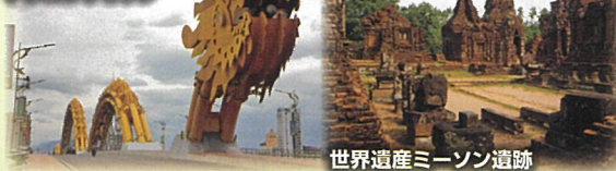
世界遺産ミーソン遺跡