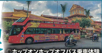
◎ホップオンホップオフバス乗車体験